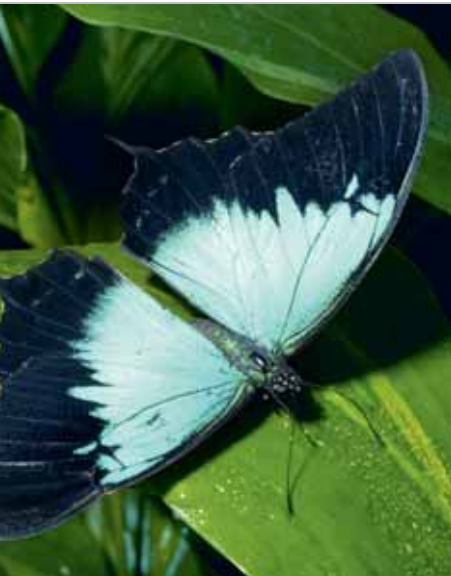
In der Natur sorgen Nanostrukturen für Farbvielfalt und Verschmutzungsresistenz

Nanoobjekte sind Materialien, die entweder in ein, zwei oder drei äußeren Dimensionen nanoskalig sind; typische Vertreter sind Nanoplättchen, Nanofasern und Nanopartikel. Als Beispiele für Nanoobjekte seien hier exemplarisch Kieselsole (Dispersion von nanoskaligem Siliciumdioxid) oder die Stoffklasse der Schichtsilikate (Phyllosilikate) genannt.