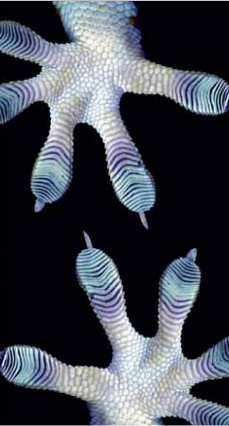
Die Füße des Tokay-Geckos finden nahezu überall Halt: Vorbild aus der Natur für universelle Haftung