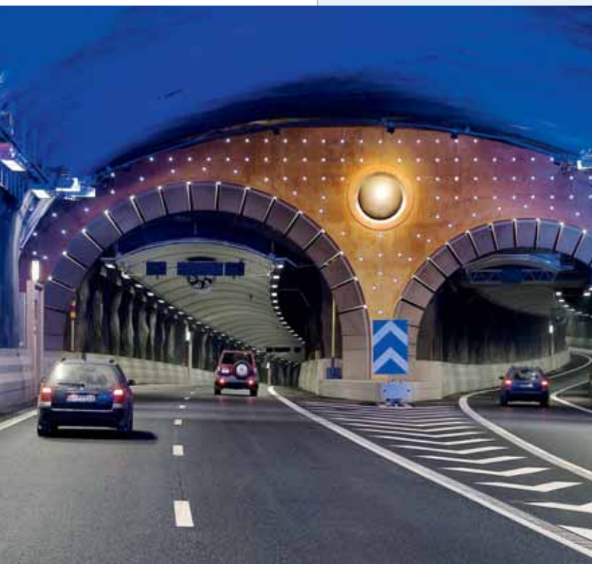
Tunnel mit nano-beschichteten Seitenprallwänden zur Reduktion der Verschmutzungsanfälligkeit und verbesserter Reinigbarkeit.

Photokatalytisch aktive Fassadenfarben mit Metalloxiden in nanostrukturierten Oberflächen von Wandfarben zerstören Luftschadstoffe. Auf diese Weise können Beschichtungen und andere Baustoffe sowohl im Innen- als auch im Außenbereich zur Reinhaltung der Luft beitragen.